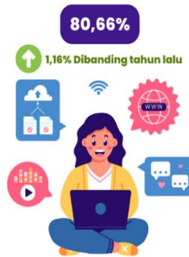
Gambar 1.1 Tingkat Penetrasi Internet di Indonesia Tahun 2025