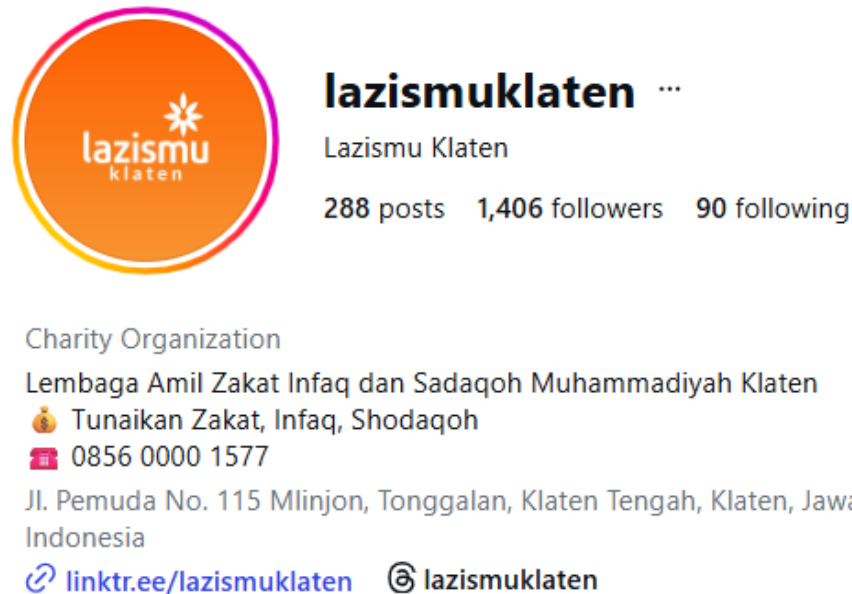
Gambar 1.5 Akun media sosial instagram @lazismuklaten

Muhammadiyah (Lazismu) Klaten. Lazismu Klaten merupakan lembaga filantropi Islam yang bergerak dalam penghimpunan dan penyaluran dana zakat, infak, dan sedekah untuk mendukung berbagai program sosial dan pemberdayaan masyarakat di daerah klaten. Dalam upaya memperluas jangkauan komunikasi dengan publik, Lazismu Klaten memanfaatkan media sosial Instagram melalui akun @lazismuklaten sebagai salah satu saluran komunikasi digital.